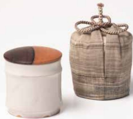
14 茶器 マヨリカ白釉