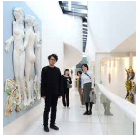
ファエンツァに滞在した陶芸家とともに ファエンツァ国際陶芸美術館展示室にて 2018年10月8日

地元の素材を用いるため、そのプロセスは踏まえつつも、施釉などのルールは現地流ではなく、あくまで新里が表現したいイメージに合わせて行われている。そのため、現地のつくり手から見れば異色の手法が取り入れられている。