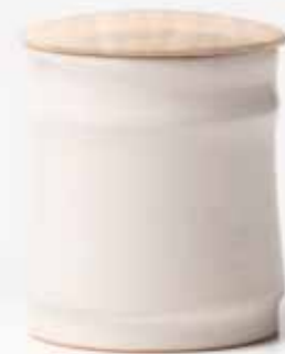
L:9 茶器 マヨリカ白釉